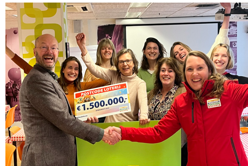
Dankbaar voor de gift van de Postcode Loterij.

Daarnaast richten we ons op de verdere groei van het aantal middle- en major donors , periodieke schenkers en nalaters. De ledenwerving vraagt in 2026 extra aandacht: de ambitieuze doelstellingen vragen om meer leads vanuit campagnes, een sterkere online wervingsstrategie en voldoende capaciteit in data en online om dit te realiseren.