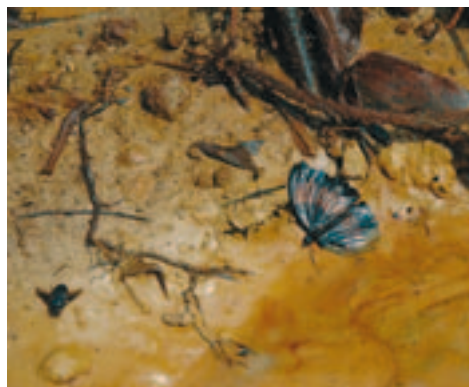
Vervuiling in Oruma

Op 7 juli 2005 stopte Shell de lekkage en vormden vertegenwoordigers van het dorp, de overheid en Shell een gezamenlijk inspectieteam om de oorzaak te onderzoeken. Er moest diep gegraven worden om de olijepijpleiding bloot te leggen: op een diepte van drie meter werd de pijpleiding zichtbaar voor het inspectieteam. Er bleek een gat in de onderkant van de pijpleiding te zitten. Volgens de dorpe-