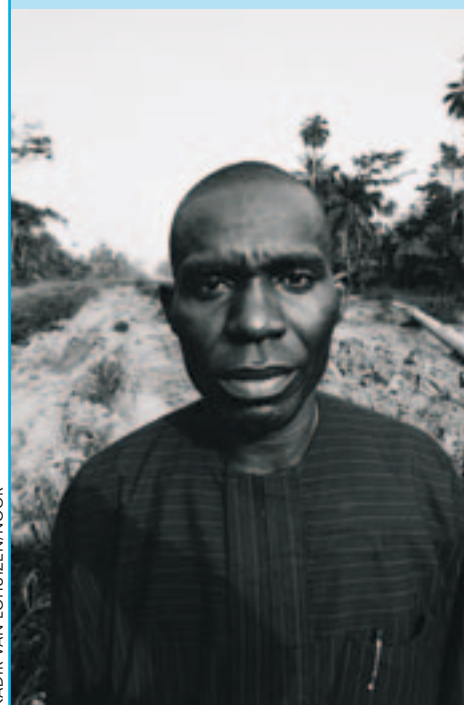
KADIR VAN LOHUIZEN/NOOR