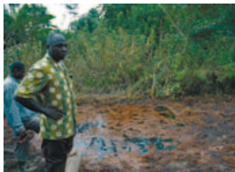
Besmeurd land in Oruma

Shell huurde een aannemer in voor de schoonmaak. Dit was in oktober/november 2005, vier maanden na de lekkage. Er werden tientallen grote gaten gegraven, sommige direct naast de visvijvers. De vervuilde grond werd hier naartoe gebracht en ver-