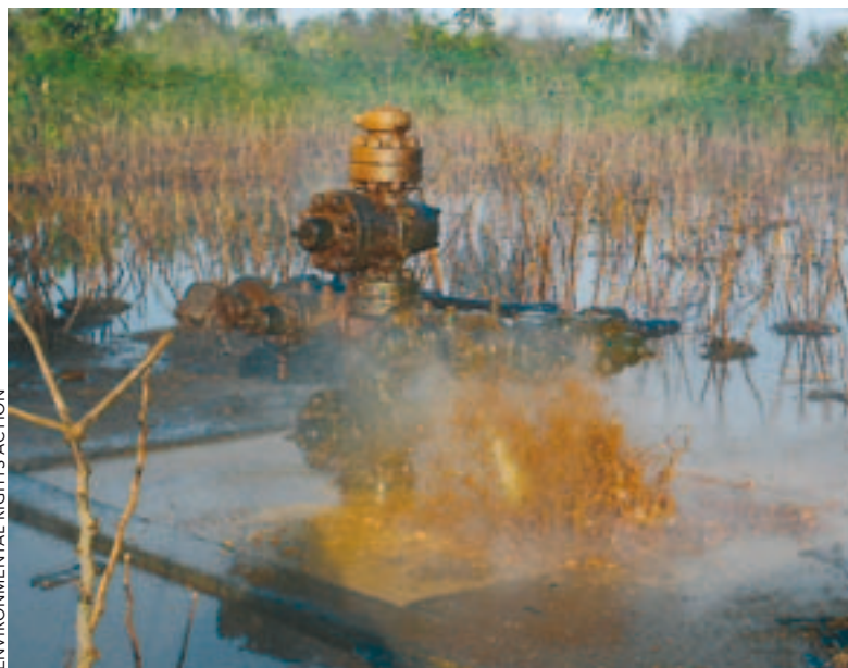
ENVIRONMENTAL RIGHTS ACTION

Oliespuitende 'kerstboom' in oktober 2007