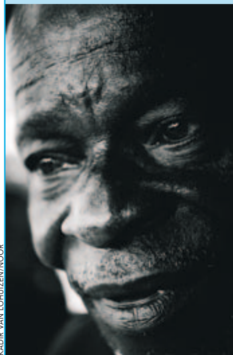
KADIR VAN LOHUIZEN/NOOR