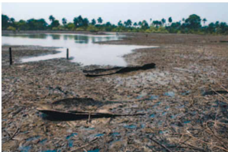
KADIR VAN LOHUIZEN/NOOR

"Ik ben nu meer dan dertig jaren in Goi. Ik moet bekennen dat ik spijt heb dat ik mij hier heb gevestigd. Ik heb niks meer. Ik hoop dat de rechter in Nederland Shell kan dwingen tot de juiste daden. Dat is mijn hoop."